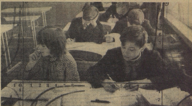
У семиклассников алгебра... Сахалинская область, Воскресенская школа.

Да, большие требования, ребята, предъявить к вам новая пятилетка. По сути, это простое слово КАЧЕСТВО подражает, а вы сказали, человек нового типа. Ученика для которого чтение учебника. Он умеет ориентироваться в огромном мире книг, учиться этому с детства. Уже в школе учиться работать с книгой самостоятельно, анализировать, выискивать, изучать, анализировать своё время, учиться первым навыкам самостоятельной, исследовательской работы, изобретательства. Хорошо ориентируется в мире взрослых профессий, не мучается мейшей возможности познакомиться с любым трудом. И главное — эту атмосферу вечного поиска, увлечённости, неутомимой любознательности, радости, которую человеку приносит знание, он делит с товарищами. Он делит всё, что бы потом, став взрослым, вспоминал свой пионерский отряд как первую настоящую трудовую семью, добрую и строгую, семью, которая дала ему путёвку в большую жизнь.